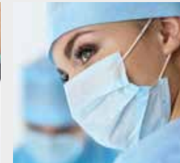
Mundschutz & Masken