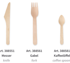
Art. 388551 Messer knife