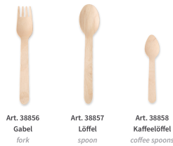
Art. 38856 Gabel fork