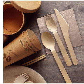
Art. 38858 Kaffeelöffel coffee spoons