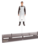
Art. 88936 Edelstahl stainless steel

Nur mit passendem Zubehör Only with suitable accessories