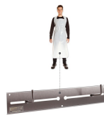
Art. 88936 Edelstahl stainless steel

Nur mit passendem Zubehör Only with suitable accessories